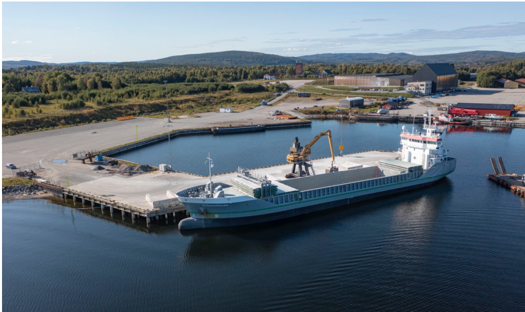
I september lämnade den första fartygslasten miljövänligt kaliumsulfat Köpmanholmen och Cinis Fertilizers produktionsanläggning för leverans till kunden Van Iperen International.