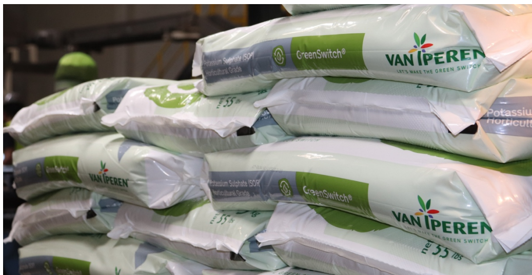
Det vattenlösliga kaliumsulfatet som producerats i Cinis Fertilizers produktionsanläggning har packats hos Van Iperen International och sedan distribuerats till kunder i cirka 25 länder över hela världen. Produkten säljs under namnet GreenSwitch SOP.